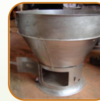
Sakkanal multi Charbon et bois Economie de combustible 40 - 45%