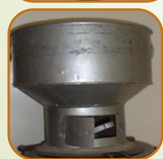
Sakkanal mono Charbon et bois Economie de combustible 40 - 45%