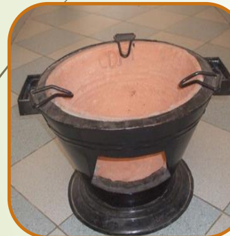
Jambar Bois Economie de combustible 40 - 45%