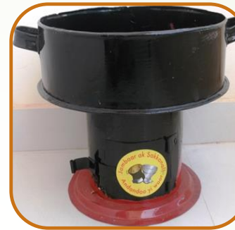
Taaru Charbon Economie de combustible 45 - 50%