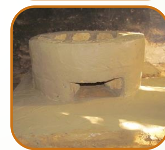
Banco domestique bois Economie de combustible 45 - 50%