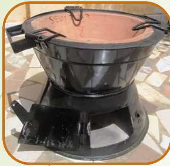
Jambar charbon Economie de combustible 30 - 35%